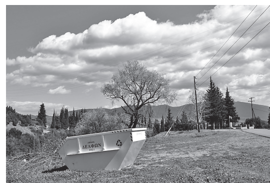
Διάφορα σημεία του δρόμου Χωριό - Πόρος