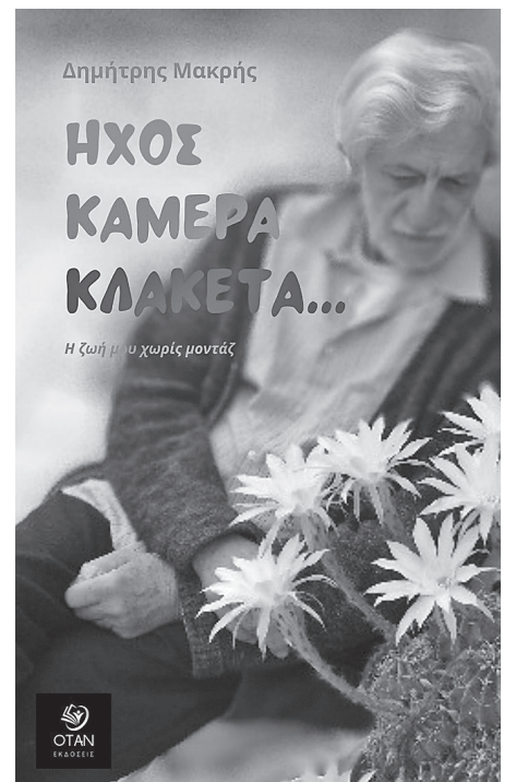
Εξώφυλλο του νέου του βιβλίου

ΠΕΡΙ ΕΡΩΤΟΣ ΛΟΓΟΙ- Συμπόσιο του Πλάτωνα, Πατέρα πήγαινε σπίτι να ξεκουραστείς, Αλκιβιάδης ο ατίθασος μαθητής του Σωκράτη, Πολύχρωμη δημιουργική ασάφεια, Η απολογία του Σωκράτη και Άχνες του making of της Απολογίας.