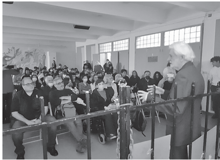
Ομιλία του στο Ιταλικό Ινστιτούτο

Όμως στην τελευταία επέτειο του Πολυτεχνείου βρέθηκα σε σχολείο του Χαλανδρίου να παρακολουθώ το «Εδώ Πολυτεχνείο». Αν και το είχα δει δυο-τρεις φορές και στο παρελθόν- ομολογώ πως μου έκανε τεράστια εντύπωση το πόσο