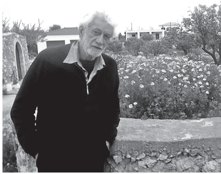
Ο σκηνοθέτης Δ.Μακρής

Παρακολουθώ χρόνια το έργο του Δημήτρη Μακρή και σίγουρα έπαιξε ρόλο και η κοινή μας καταγωγή από τα Κα-