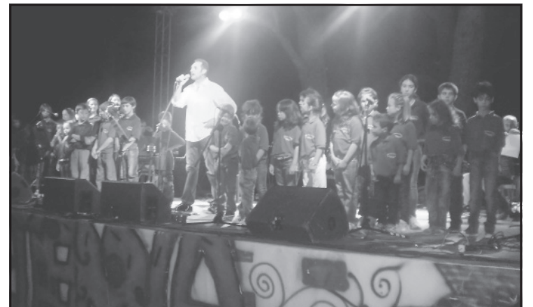
Καστελλιώτικο Πολιτιστικό Αύγουστο.

τάμι, δίπλα στο παλιό γεφύρι, αξιοποιώντας ένα θαυμάσιο για το σκοπό αυτό χώρο) έλαβαν χώρα στο προαύλιο του