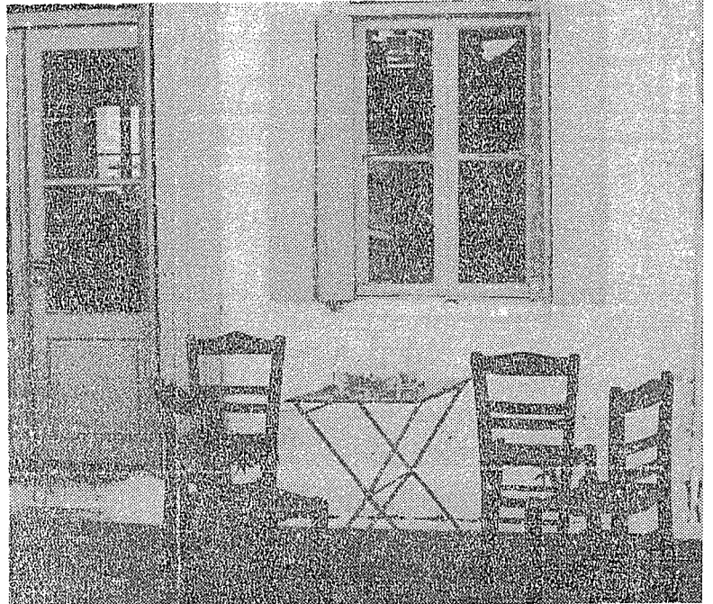
Η ανάπαυση του καφενείου...

Ας σταματήσουμε —επί τέλους— τα «λαϊκά πανηγύρια», με τα σουβλάκια και τις κομμωτικές φυλλάδες, που βρίσκουν την ευκαιρία να «περάσουν» τα διάφορα «στρατευμένα» παιδιά με την ευκαιρία της επετείου του Πολυτεχνείου. Ας μείνουμε βουβοί και σκεπτικοί σ' αυτά που μας οδήγησαν στις μέρες του Πολυτεχνείου και ας υποσχεθούμε στον εαυτό μας να μην ενδόσουμε ΠΟΤΕ σε οποιοδήποτε μέσο θελήσει να μας ξαναγκρεμίσει την καγκελόπορτα της εθνικής μας ομοψυχίας. Με τη προσωπική μας αντίσταση, σε κάθε προσπάθεια διατάραξης της Ελληνικής ελευθερίας και δημοκρατίας, θα σταθούμε μνημόνες και συνεχιστές όλων εκείνων που έδωσαν το παρόν με το μεγάλο τους ΟΧΙ, στις 17 Νοεμβρίου 1973.