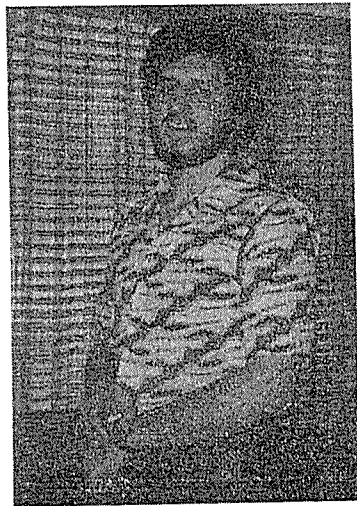
Πανεπιστήμιο της Καμπέρα - Αυστραλίας.

Ο κ. Σπύρος Χαρ. Κουτρούμπας πήρε το πτυχίο του στις Οικονομικές Επιστήμες από το