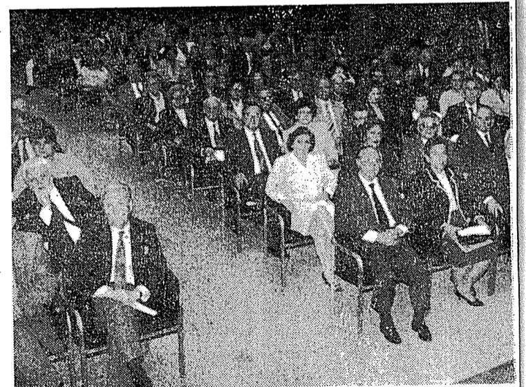
Η αίθουσα ήταν κατάμεστη αρκετά πριν αρχίσει η εκδήλωση.