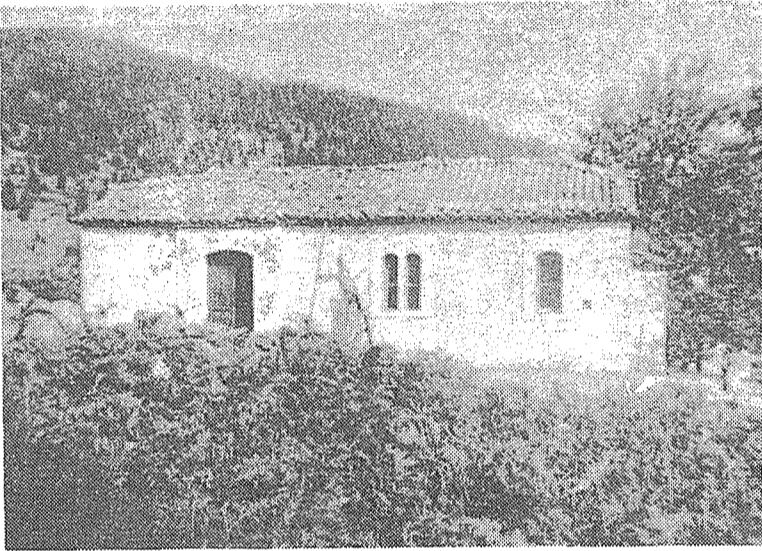
Ή Άγία Τριάδα της Καλοσκοπής.

... Ό άδικος χαμός τώσαν παλικαριών δυνάμωσε το μίσος