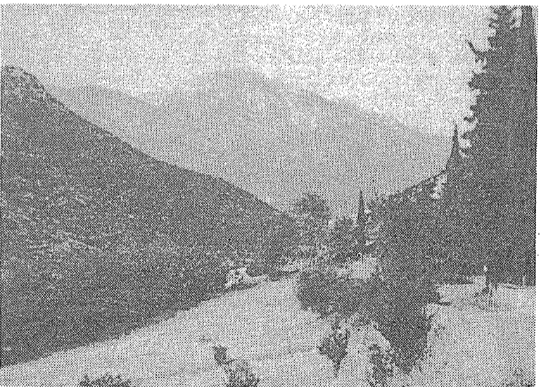
Ή Στενή και τό Μ'τσέσι.

τών ανταρτών και του λαού κατά των κατακτητών. Ή μανία που κατείχε όλους τους αντάρτες δεν περιγράφεται και στις μάχες που ακολούθησαν την ίδια μέρα. Τα τμήματά μας, με πρωτοφανή όρμη, τσάκισαν και κυνήγησαν ως τα Καστέλλια και τη Γραβιά τους χιτλερικούς. Ή πολλοί απ' αυτούς έμειναν